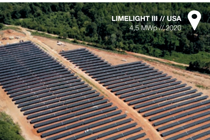
LIMELIGHT III // USA 4,5 MWp // 2020

Die dargestellten Projekte stellen mögliche mittelbare Anlageobjekte des „HEP – Solar Portfolio 2“ dar, in die nach Einwerbung von ausreichend Kommanditkapital investiert werden könnte. Die Verfügbarkeit der dargestellten Anlageobjekte ist sowohl vom Zeitpunkt, als auch von der Höhe des eingeworbenen Kommanditkapitals abhängig und kann sich jederzeit ändern. Eine konkrete Investitionsentscheidung ist noch nicht getroffen worden. Der abgebildete hep-Solarpark „Limelight III“ ist nicht Investitionsgegenstand des Publikums-AIF „HEP – Solar Portfolio 2“.